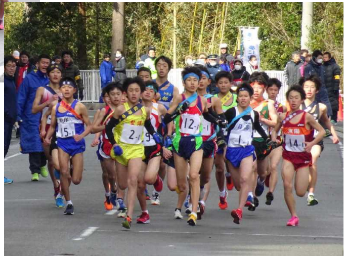
第51回大会：女子1区と男子スタート

日時 平成31年1月19日(土) 発走 女子 10時30分 男子 11時30分 場所 日高川ふれあいドーム周辺コース 主催 日高地方中学校体育連盟 田辺・西牟婁学校体育連盟 東牟婁地方中学校体育連盟 後援 日高地方陸上競技協会 田辺・西牟婁陸上競技協会 御坊市教育委員会 日高地方教育委員会連絡会